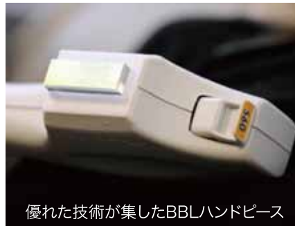
優れた技術が集したBBLハンドピース

Dr. マノメディカルサロンではこの治療をいち早く導入し、皆様に安心してハリのあるみずみずしい肌を保つお手伝いをいたします。